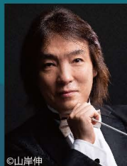
指揮・飯森 範親 (群馬交響楽団常任指揮者)